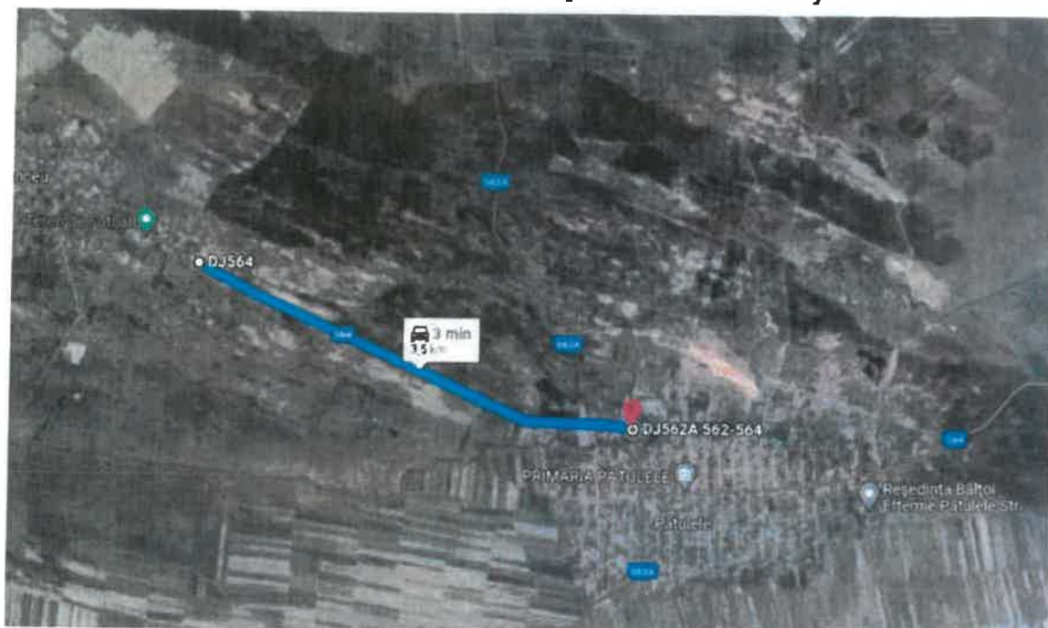
DJ 564 Sector 2, Tronson 2 [(Patulele int cu DJ 562A) – Danceu]

Localitatile traversate de DJ 564 pe sectorul 2 sunt urmatoarele: