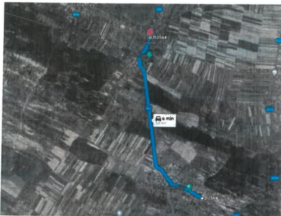
DJ 564 Sector 3, Tronson 1 [Danceu – Jiana (int. cu DJ 606)]

Terenul pe care este amplasata investitia, aparține județului Mehedinti, si se situeaza în intravilanul si extravilanul localitatilor Danceu - Jiana - Scapau.