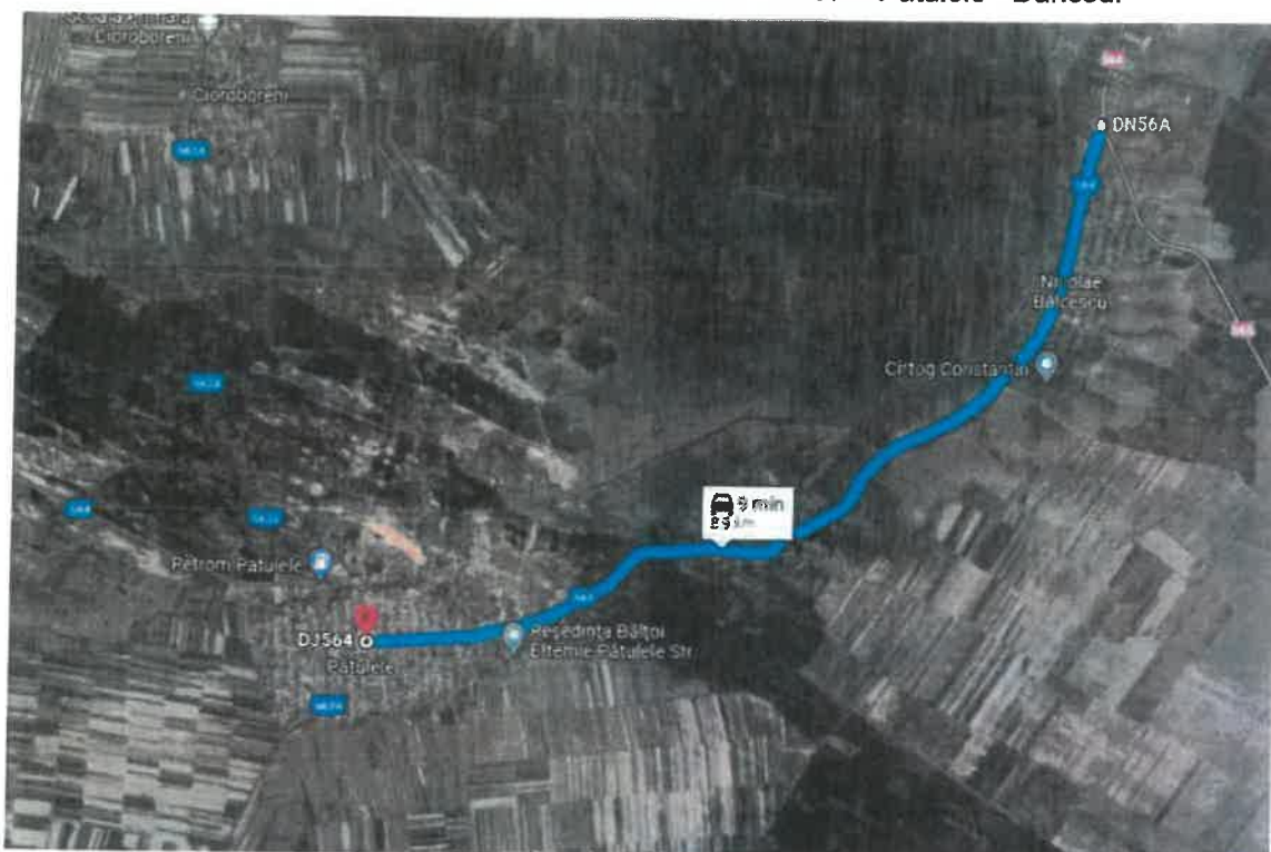
DJ 564 Sector 2, Tronson 1 [int. DN 56A – Patulele]

Terenul pe care este amplasata investitia, apartine județului Mehedinti, si se situeaza în intravilanul si extravilanul localitatilor Nicolae Balcescu - Viasu – Patulele - Danceu.