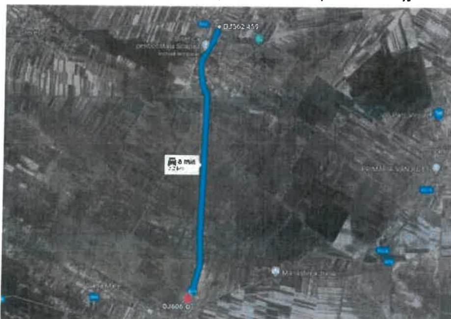
DJ 564 Sector 3, Tronson 2 [Jiana (int. cu DJ 606) – Scapau (int. cu DJ 564)]